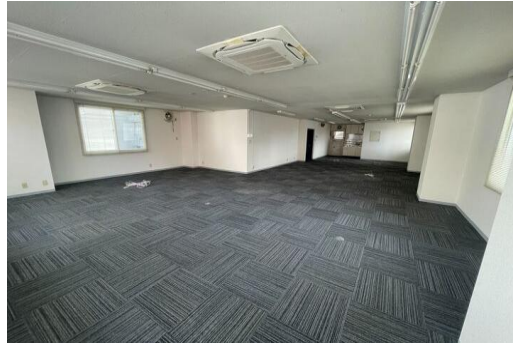
※こちらは現入居者入居前の写真であり、現況を優先します。