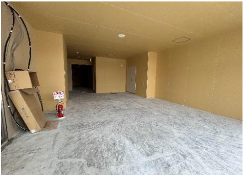
※前入居者の入居前写真のため現況と異なる場合がございます。