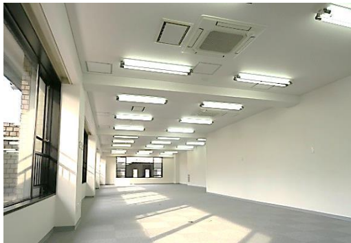
※前入居者の入居前写真のため現況と異なる場合がございます。