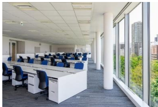
※デスク・チェアはイメージです。