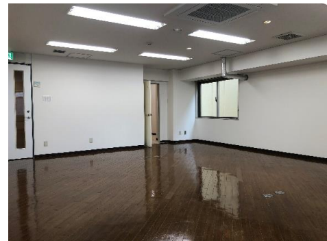
※前契約者入居前の写真につき現況と異なる場合がございます。