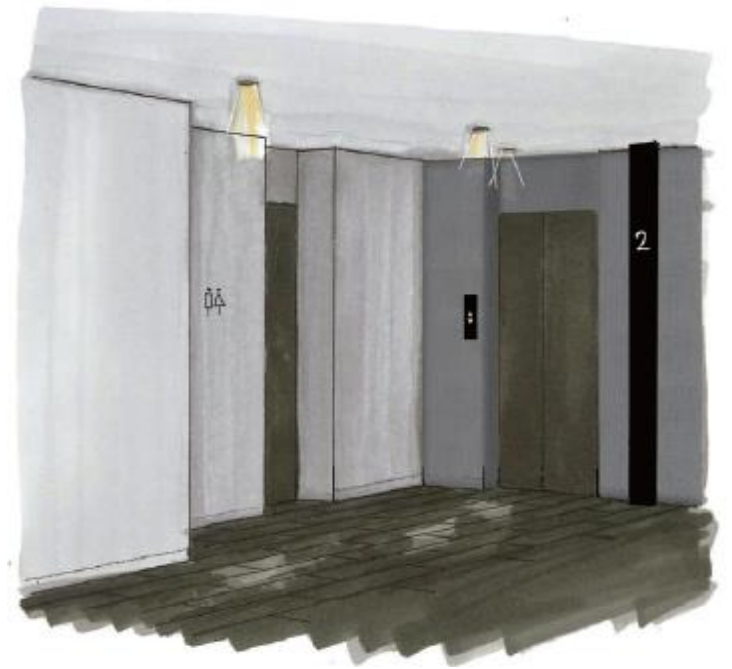
2階エレベーターホール