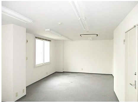
※引渡前の写真になります。