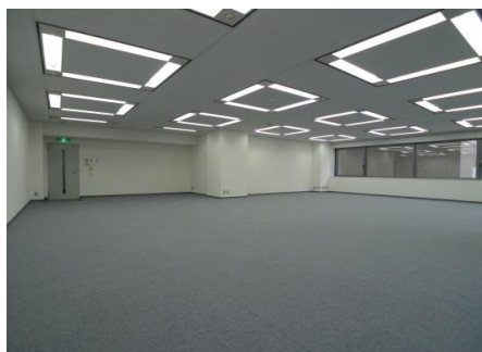
※こちらは現入居者入居前の写真であり、現況を優先します。