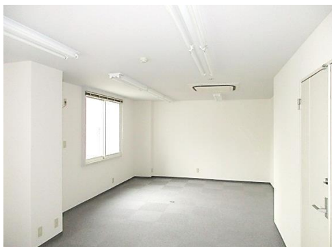
※こちらは現入居者入居前の写真であり、現況を優先します。