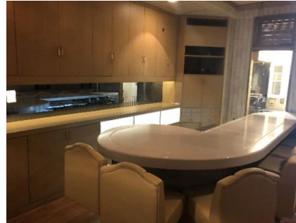
※前契約者の引き渡し時の写真につき、現況と異なる部分がございます。