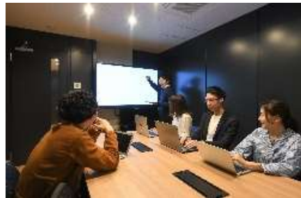
ミーティングルーム