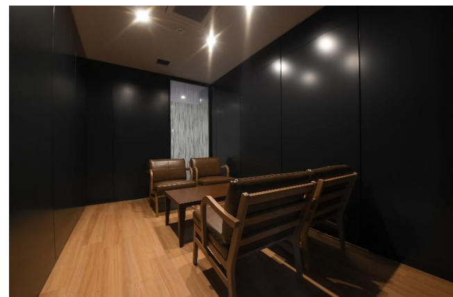
ミーティングルーム2は4人掛けの応接室タイプ！