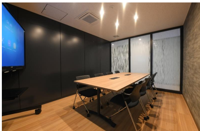
ミーティングルーム1は8名掛けで電子ホワイトボード完備！