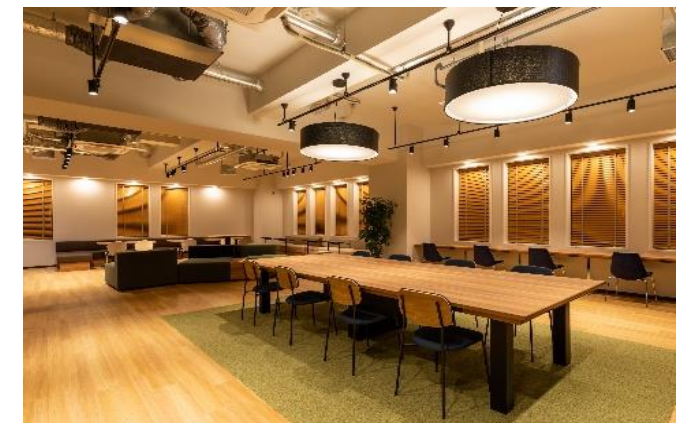
タイプの違う席が複数あり、用途に合わせて使用できます！