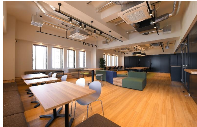
ラウンジスペースはフリーWi-Fi完備で仕事もできます！

5階ラウンジ(約30席)は 無料で使用可能！ 3パターンの ミーティングルームも 無料使用可能！(要予約)