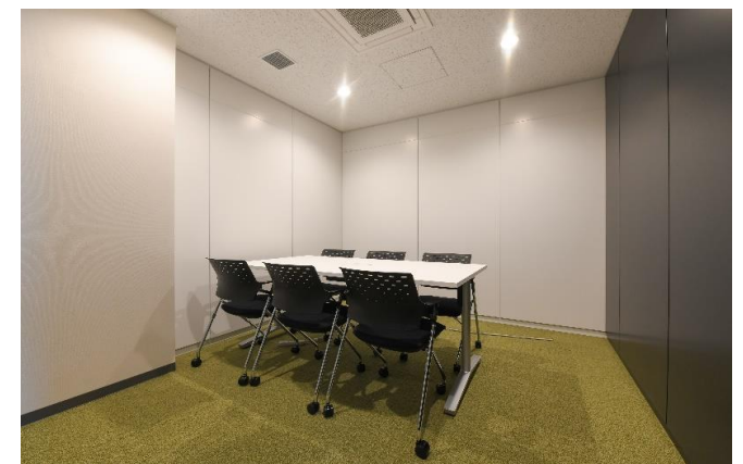
ミーティングルーム3はオーソドックスな6人掛け！