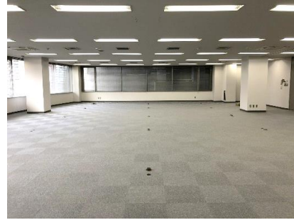
※写真は現入居者入居前のものであり、 現況を優先いたします。