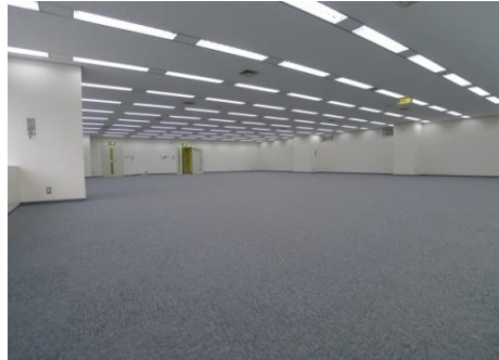
※現契約者入居前の写真のため、現況優先いたします。