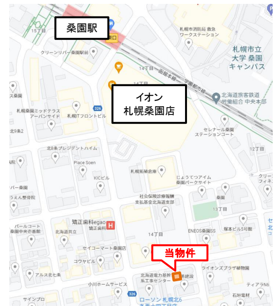
※コンピューター作図につき、現況を優先いたします。