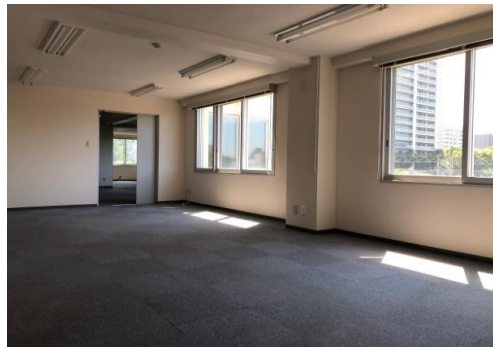
※室内写真は現賃借人入居時のものです