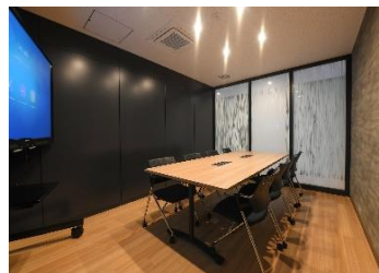
ミーティングルーム